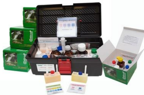
Контроль сточной воды (охрана окружающей среды)