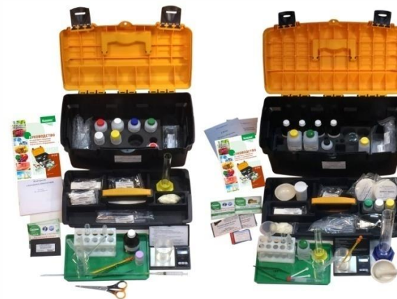
Санитарно-пищевой контроль (безопасность питания)