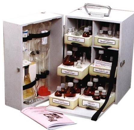
Анализ производственных вод ТЭС (энергетика)