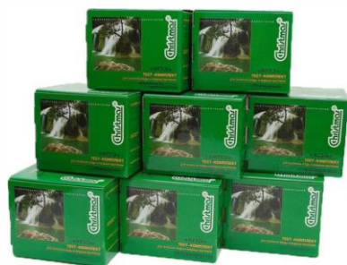
Анализ питьевой и природной воды (гигиена, экология, гидрология и т.п.)