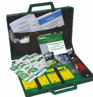
Индикаторные трубки и МЭЛ для контроля воздуха и промвыбросов