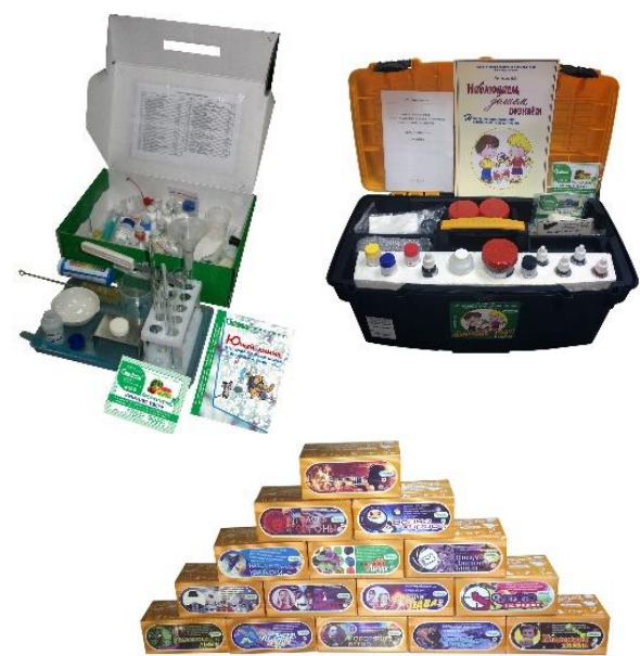
Учебные и детские изделия - наборы