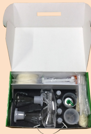
Набор учащегося для химико-экологического практикума в открытом виде