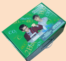
Набор учащегося для химико-экологического практикума

Укладка-лаборатория учителя дополняется модулями, предусмотренными в заказанной модификации (см. табл. 3). Средства дополнительной комплектации уложены отдельно от базовой укладки.