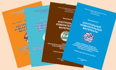
Комплект контрольных измерительных материалов