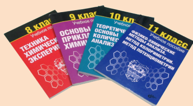
Комплект учебно-методических пособий для учащегося

Набор учащегося для химико-экологического практикума представляет собой простую укладку контейнерного типа с ложементом и содержит необходимые при практических работах принадлежности и посуду, а также учебные пособия для учащегося и сопроводительную документацию. Один набор рассчитан на одновременную работу 2-4 учащихся.