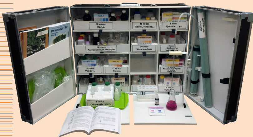
Укладка-лаборатория учителя ШХЭЛ в раскрытом развернутом виде

Является оригинальным учебно-методическим комплектом, разработанным специально для целей и задач химико-экологического практикума учащихся 8–11 классов под зарегистрированной товарной маркой «КРИСМАС» (свидетельства № 404860, № 570418).