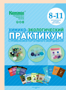
Химико-экологический практикум. Пособие для учителя