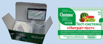
Некоторые образцы тест-систем для санитарно-пищевого анализа