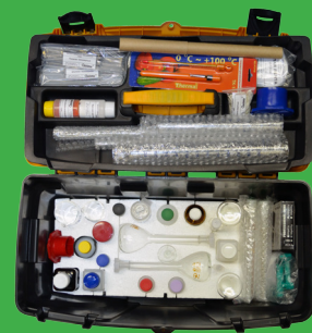
Экспресс-лаборатория «Контроль качества мёда»