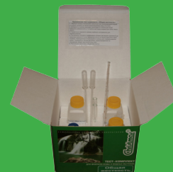
Тест-комплект «Общая жёсткость»