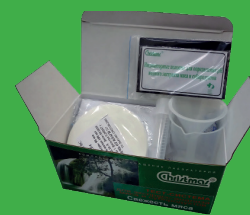
Тест-система «Свежесть мяса»