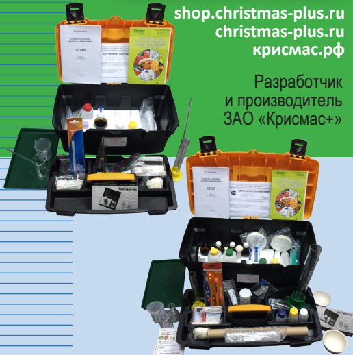
Санитарно-пищевая экспресс-лаборатория СПЭЛ

Разработчик и производитель ЗАО «Крисмас+»