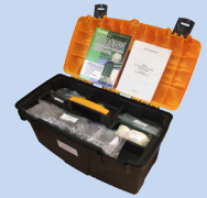
Набор для гидробиологических исследований