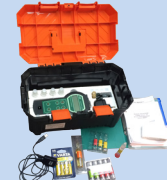
Набор-укладка для фотоколориметрирования Экотест-2020-К

Дополнительные модули к лабораториям НКВ-Р