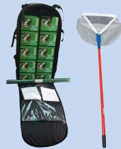
Ранцевая полевая лаборатория исследования водоёмов НКВ-Р с сачком гидробиологическим

Полевые лаборатории анализа воды типа НКВ являются оригинальными изделиями, разработанными и производимыми ЗАО «Крисмас+». Данные изделия производятся под зарегистрированной товарной маркой «КРИСМАС» (свидетельство № 404860, № 570418) и защищены патентом РФ № 96342.