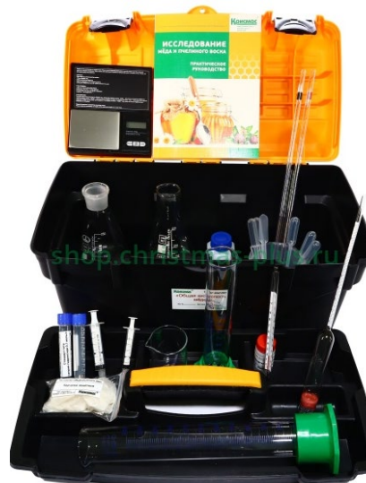
ТК «Общая кислотность мёда»