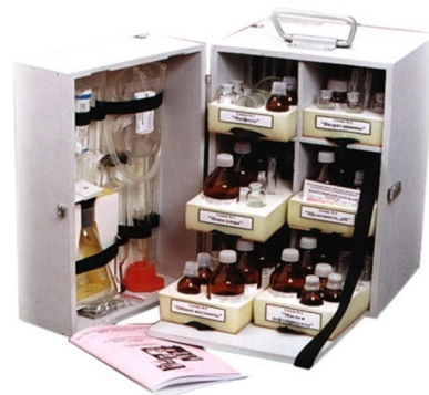
Портативные лаборатории контроля производственных и технологических вод

Учебно-методические комплекты и комплексы высшего профессионального образования