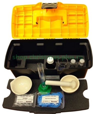
ТК «ГМФ в мёде»