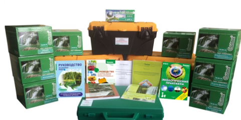
Учебно-методические комплекты и комплексы высшего профессионального образования

Химико-аналитический контроль по выделенным показателям