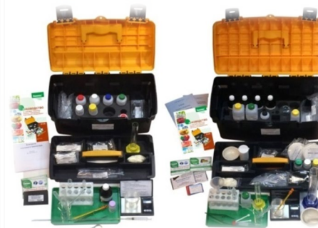
Портативные лаборатории для санитарно-пищевого анализа