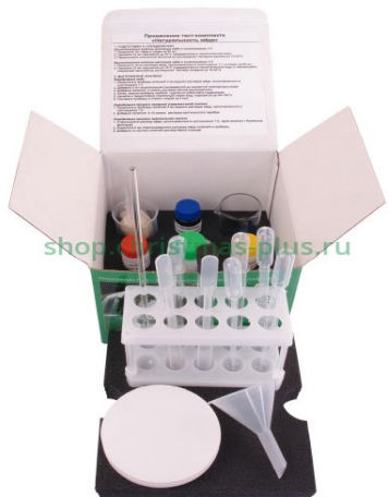
ТК «Натуральность мёда»