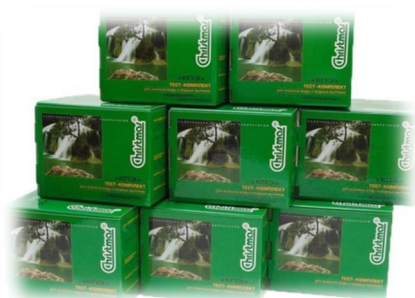
Тест-системы и тест-комплекты

Химико-аналитический контроль по выделенным показателям