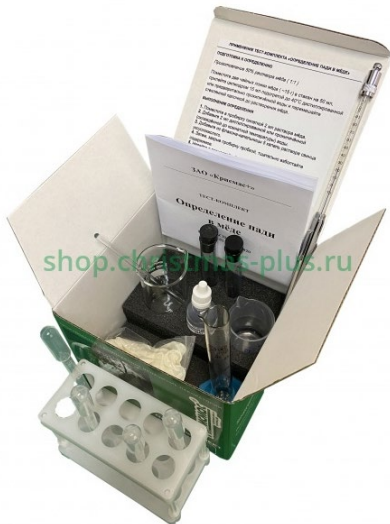
ТК «Падь в мёде»