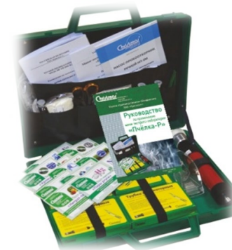
Индикаторные трубки и МЭЛ