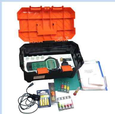
Набор-укладка для фотоколориметрирования «Экотест-2020-К»

Поставляется в модификациях (таблица 2, стр. 4).