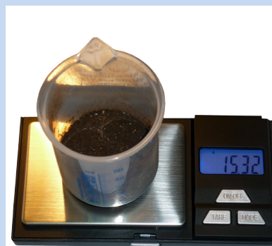
Весы портативные цифровые